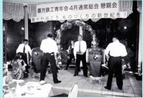
■アトラクション 小倉祇園太鼓(女無法松の会)