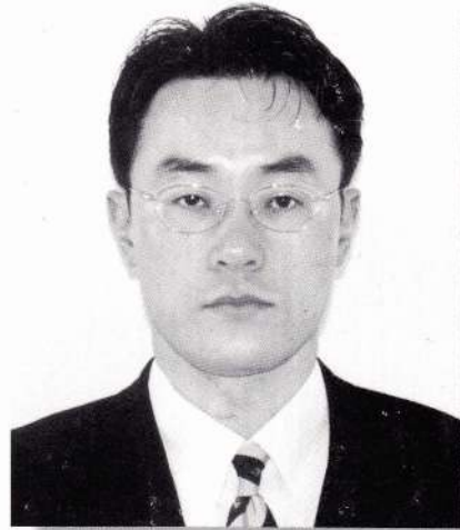
直方鉄工青年会 第37代会長

二つ目の波が国際化です。国際化やボーダーレスと言う言葉はすでに言い古された感がありますが、現在ほど我々の日常の企業活動において切実に感じられる時期はありません。入札の競争相手が海外メーカーであったり、自社の素材調達先の候補に海外